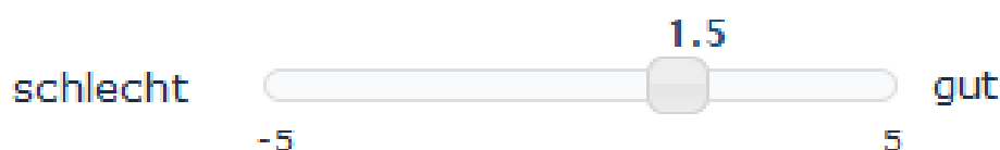
Abb. 2: Realisierung des Moduls 4 als Schieberegler zur Erhebung des Gesamturteils

Erweitert wurde die modulare Struktur des Fragebogens um die Erhebung eines Gesamturteils (Modul 4). Verfügbare Fragebögen zum Nutzungserleben (z.B. AttrakDiff und UEQ ) erfassen dieses Gesamturteil unter der Bezeichnung „Attraktivität“ als zusätzliche Subskala. In meCUE wurde die Skala als feinabgestuftes semantisches Differenzial mit den Polen „schlecht“ und „gut“ realisiert. Die bisherige Umsetzung im Fragebogentool LimeSuvey® gestattet, die Auswahl zwischen den insgesamt 21 Abstufungen über einen Schieberegler vorzunehmen (siehe Abb. 2). Die durch dieses Modul erweiterte Struktur von meCUE zeigt Abbildung 3.